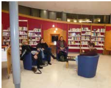
Détente bouquins une fois par mois. Présentation des nouveautés du moment. Rendez-vous le 6 janvier de 12h à 13h

Inscription à la médiathèque sur présentation d'une pièce d'identité