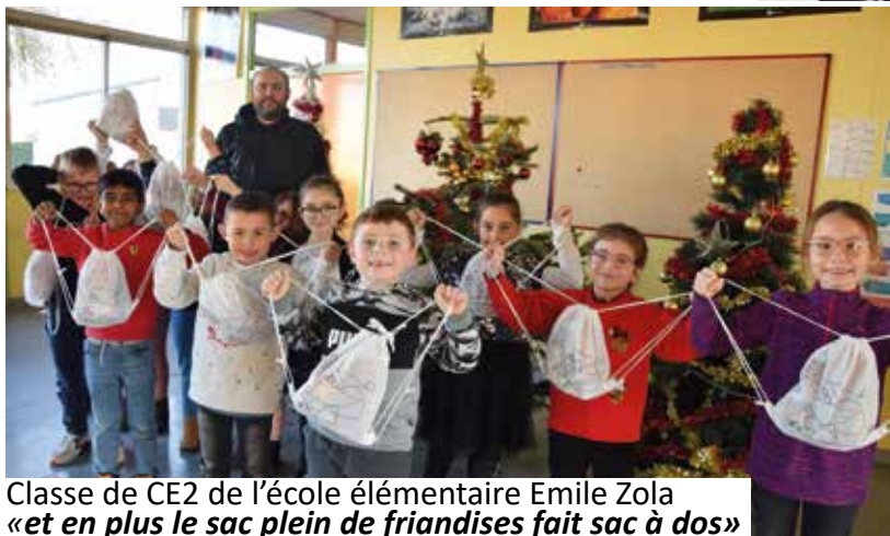
Classe de CE2 de l'école élémentaire Emile Zola «et en plus le sac plein de friandises fait sac à dos»

Auparavant, Saint-Nicolas a distribué également de bonnes choses aux élèves.