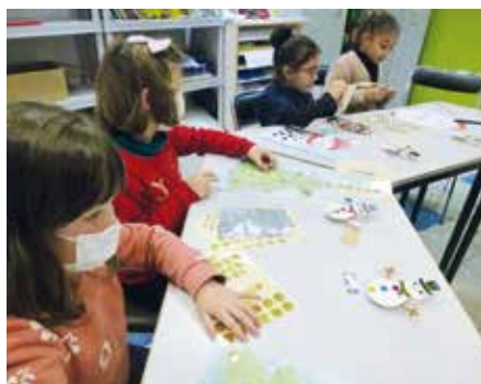
Atelier petites mains pour les 4/6 ans sur inscription : rendez-vous le 11 janvier de 15h à 16h45