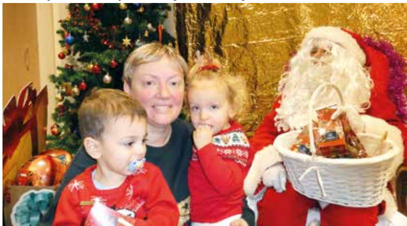
Fête de Noël au Relais Petite Enfance. Les tout-petits ont eu la joie de voir le Père Noël. Il avait un chocolat et un cadeau pour chacun dans sa hotte. Les 32 enfants sont repartis avec un sourire joyeux ainsi que leurs assistantes maternelles.

avec son âne et l'association Vallée d'Auno en Fête pour les élèves du groupe scolaire Jules Ferry