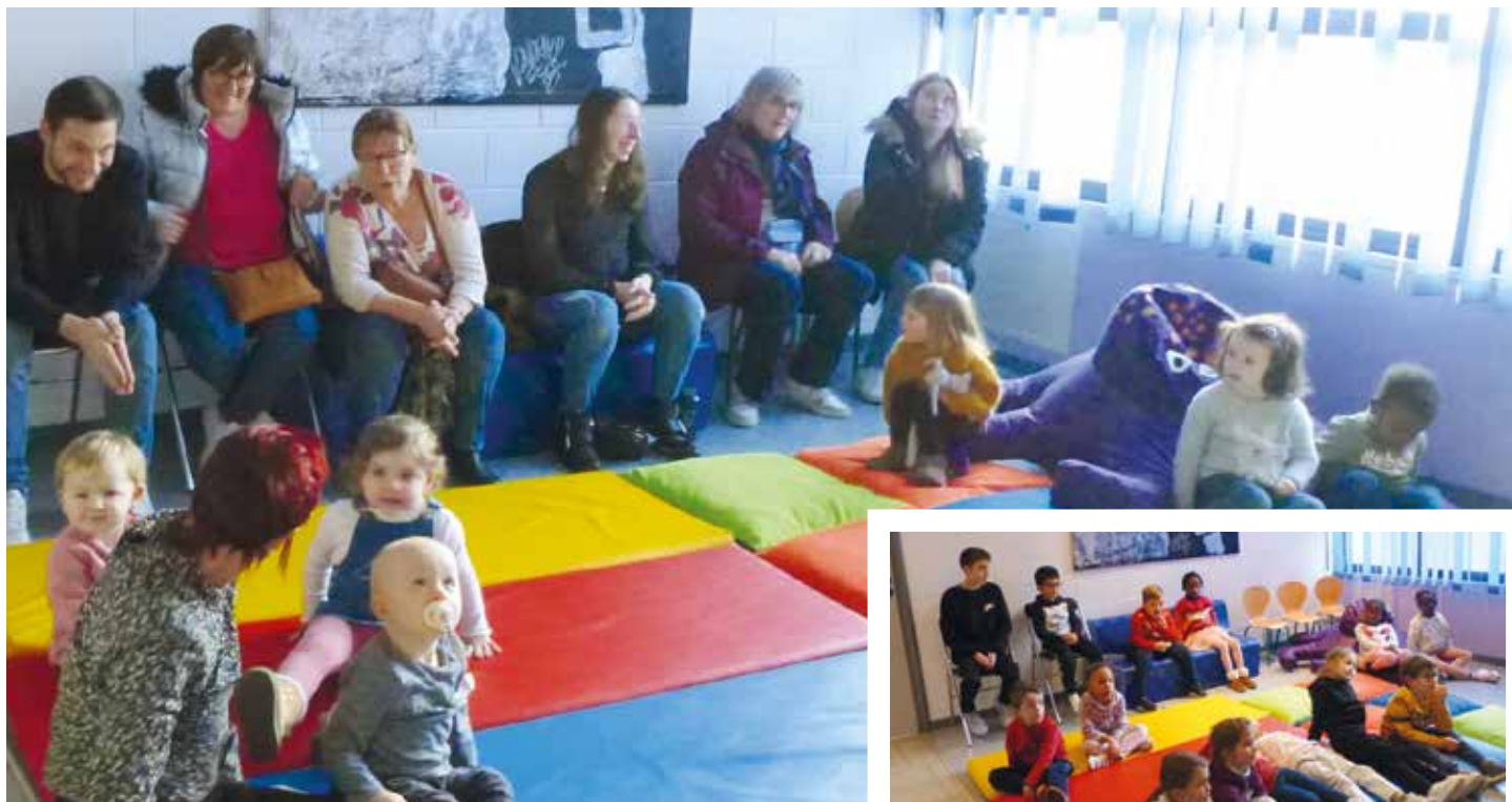
Contes de Saint-Nicolas pour les bébés lecteurs à la médiathèque : l'écoute favorise l'attention, les émotions et stimule tous les sens. Rendez-vous le 4 janvier 2023 pour la prochaine séance bébés lecteurs