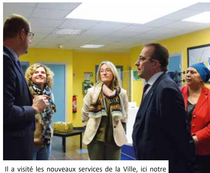
Il a visité les nouveaux services de la Ville, ici notre espace France Services...