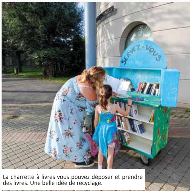
La charrette à livres vous pouvez déposer et prendre des livres. Une belle idée de recyclage.

Un change-bébé et du mobilier adapté aux nourrissons seront prochainement installés pour que parents et enfants soient plus confortablement installés.