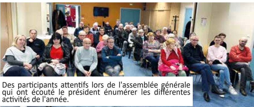
Des participants attentifs lors de l'assemblée générale qui ont écouté le président énumérer les différentes activités de l'année.