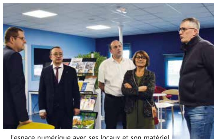
...l'espace numérique avec ses locaux et son matériel à la pointe qui accueille un public intergénérationnel...