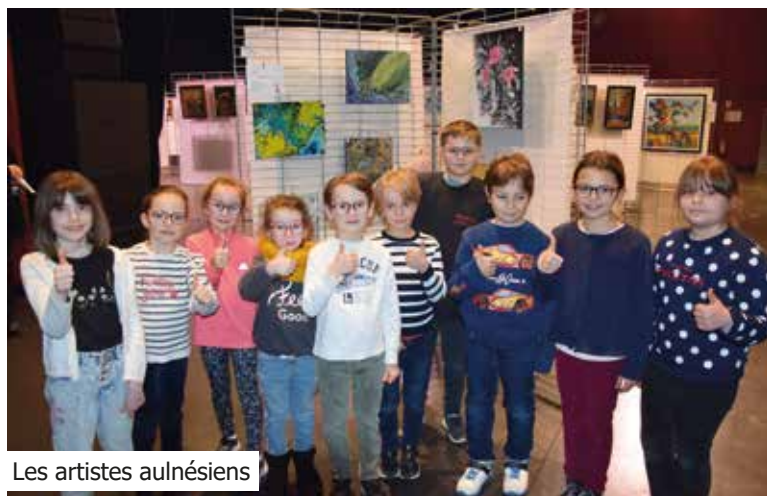
Les artistes aulnésiens