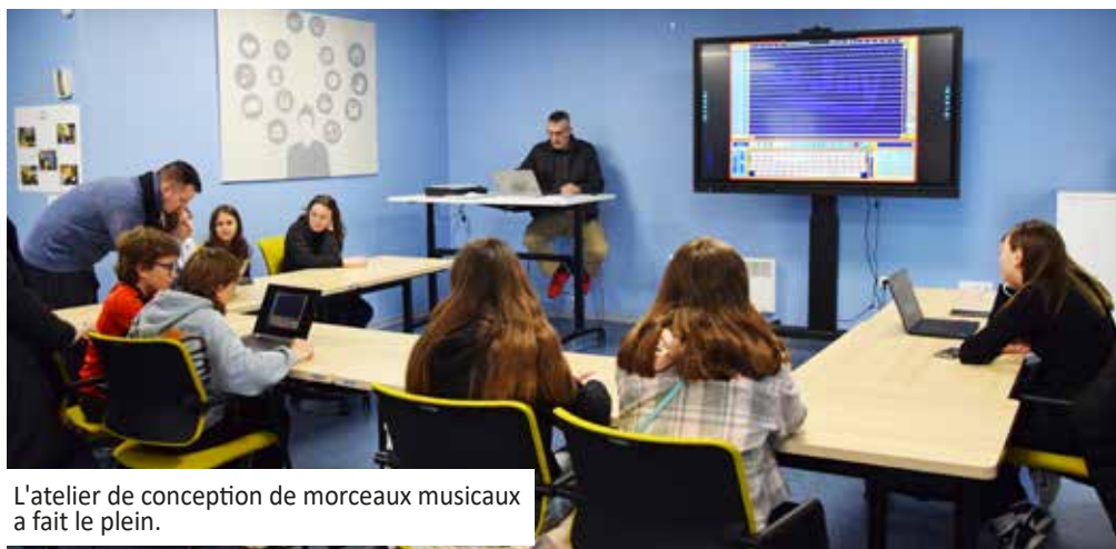
L'atelier de conception de morceaux musicaux a fait le plein.