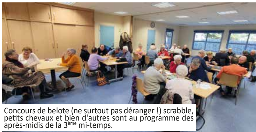
Concours de belote (ne surtout pas déranger !) scrabble, petits chevaux et bien d'autres sont au programme des après-midis de la 3 ème mi-temps.