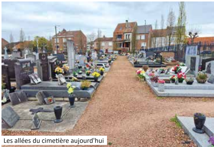
Les allées du cimetière aujourd'hui