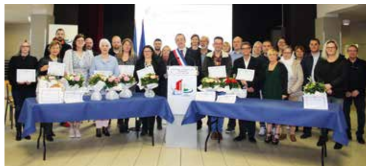
Les photos des médaillés du travail sont à retrouver sur : aulnoylezvalenciennes.fr

A l'occasion du 1 er mai, les membres du conseil d'administration du CCAS ont offert à ces personnes un bouquet de muguet et de roses. Les fleurs mais également les échanges ont été appréciés.