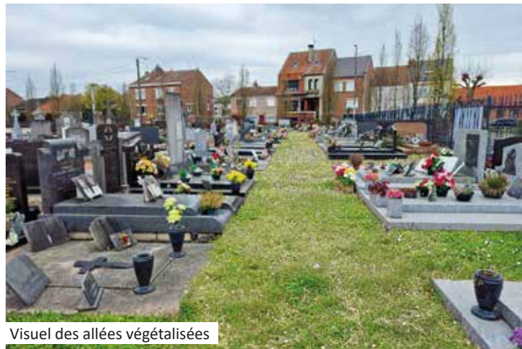
Visuel des allées végétalisées