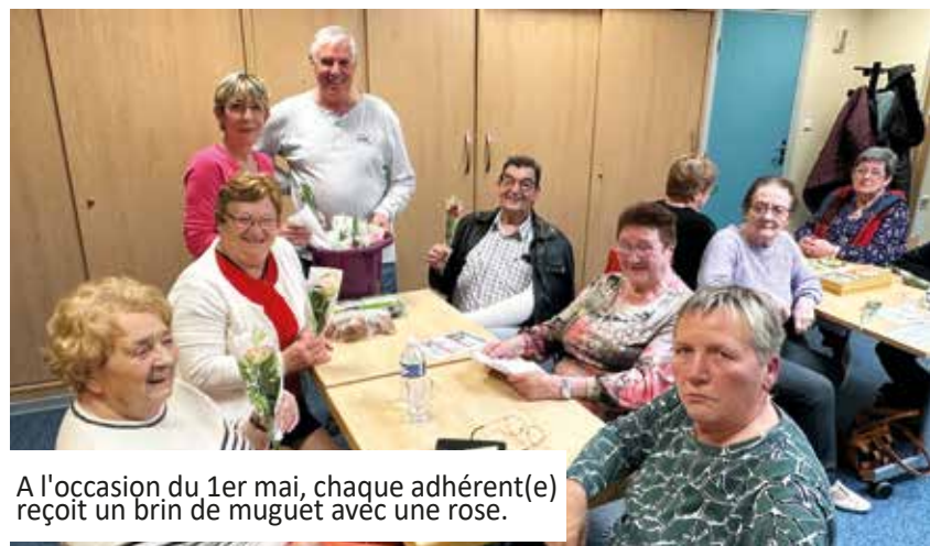
A l'occasion du 1er mai, chaque adhérent(e) reçoit un brin de muguet avec une rose.