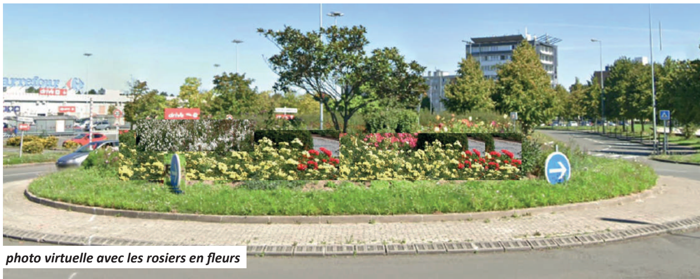
photo virtuelle avec les rosiers en fleurs

Au fleurissement traditionnel qui décorait autrefois nos massifs, la municipalité investit aujourd'hui dans un fleurissement diversifié et plus durable pour embellir la ville. Dès le printemps ce sont des bulbes naturalisés qui évoquent le retour des beaux jours en égayant nos pelouses.