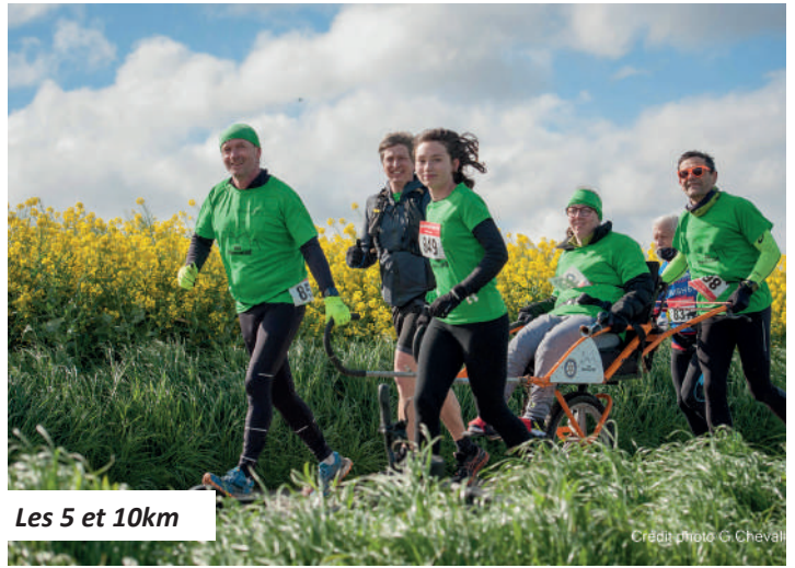
Les 5 et 10km