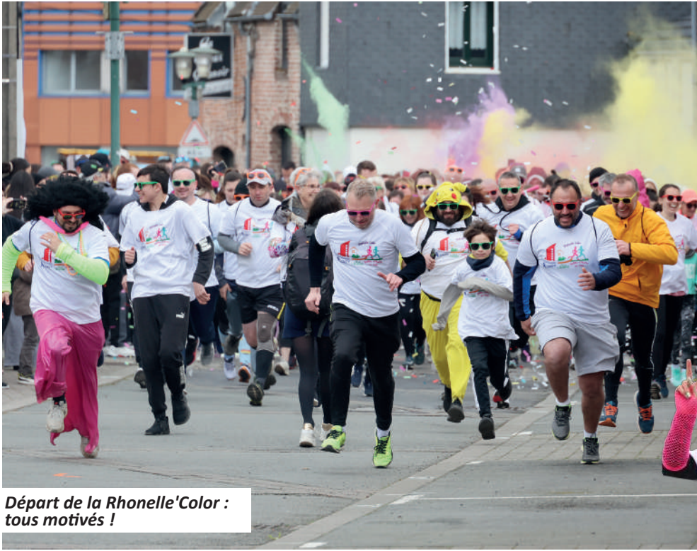
Départ de la Rhonelle'Color : tous motivés !