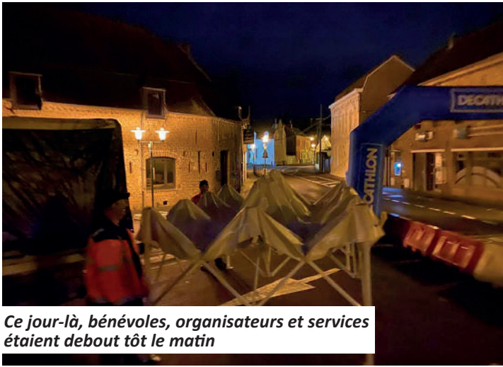
Ce jour-là, bénévoles, organisateurs et services étaient debout tôt le matin