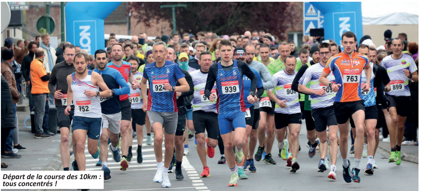
Départ de la course des 10km : tous concentrés !